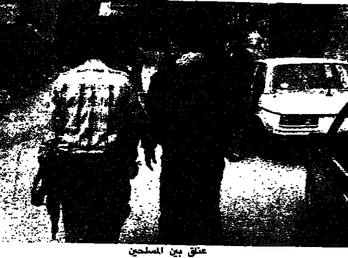
علاق بين المسلحين